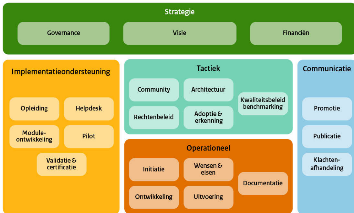
Figuur 2 BOMOS Activiteitendiagram